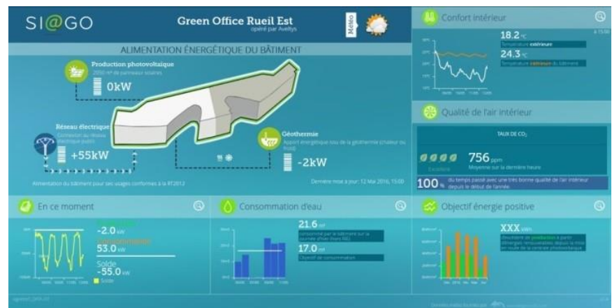
Dashboard de SI@GO pour le GreenOffice Rueil Est à Rueil Malmaison

SI@GO a été initialement conçu afin de gérer la performance énergétique d’un Bâtiment à Énergie Positive (BEPOS) associée à une garantie de performance énergétique. Dès 2015, SI@GO intègre des fonctions novatrices comme la simulation de consommation, la gestion du confort et la gestion de la communication à travers la mise en place de Dashboard de synthèse et adaptés à chaque type d’utilisateur.